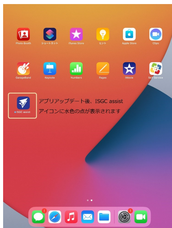
図2 ISGC assist のアイコン