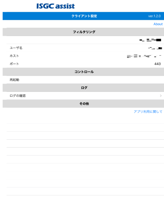
図3 ISGC assist App トップ画面

3. ISGC assist のアイコンをクリックすると、アプリの画面が表示されます (図 3)。