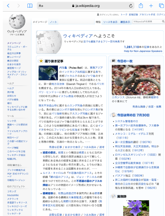
図4 Web ページが表示される

4. ブラウザに戻り Web サイトにアクセスすると、ページが表示されます (図 4)。